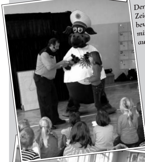
Eine große Polonaise mit allen Kindern, der Polizei und Poldi war toll.