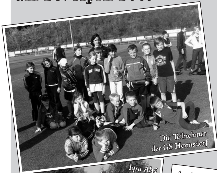
Die Teilnehmer der GS Hermsdorf