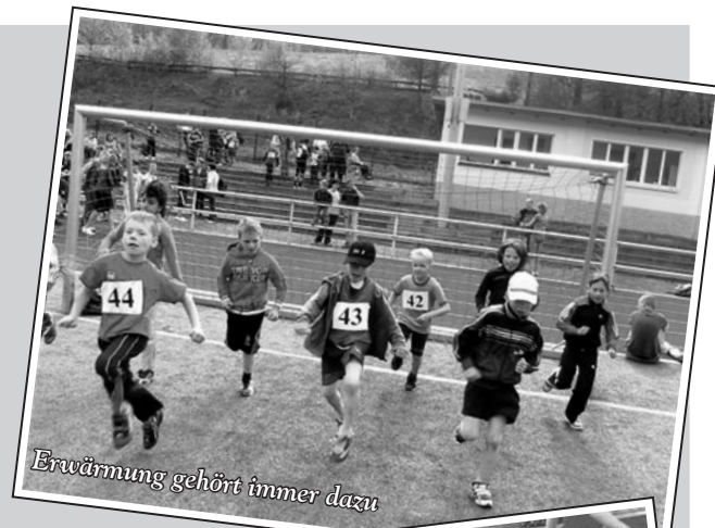
Erwärmung gehört immer dazu