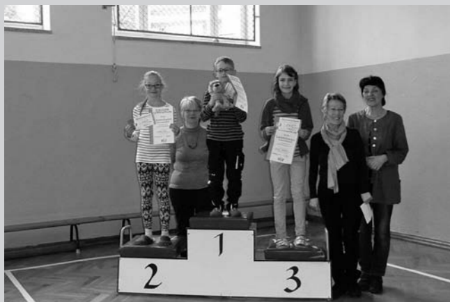
Die besten Vorleser konnten sich über wertvolle Buchprämien freuen.