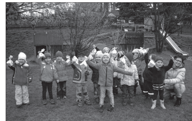
Für uns alle hat der Osterhase ein Nest versteckt!

Es sitzt ein grauer Herr im Klee, tut niemand was zu leide. Trägt eine Blume, weiß wie Schnee, hinten an seinem Kleide. Zwei Löffel hat er auch dabei, doch nicht für Suppe oder Brei. Maust von den Rüben und vom Kohl! Nun sagt, wie ist sein Name wohl?