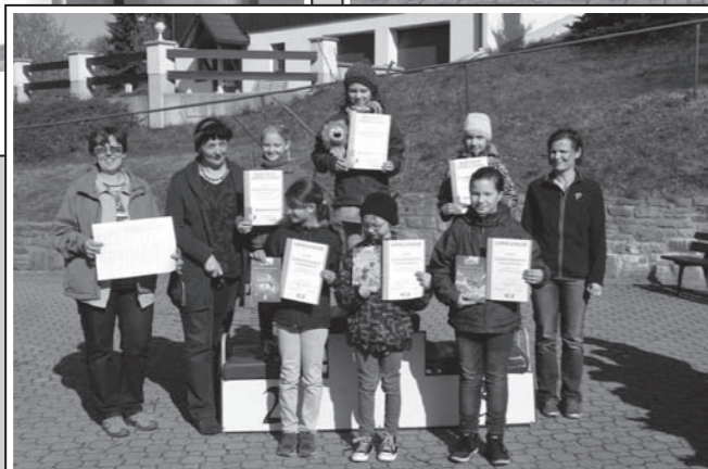
Vielen Dank an unseren Förderverein für die freundliche und äußerst kompetente Unterstützung!