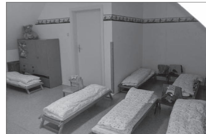
Gern betreten wir den freundlich gestalteten Raum.

DANKESCHÖN dem Elternrat, der mit viel Mühe den Schlafraum unserer Mittelgruppe liebevoll renovierte! Die Kinder nahmen ihr neues Reich ganz aufgeregt in Besitz.