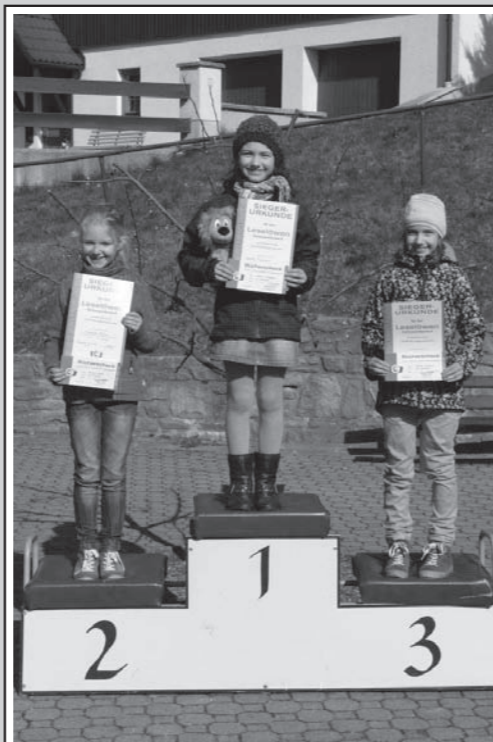
Die besten Vorleser der Grundschule Hermsdorf im April 2014