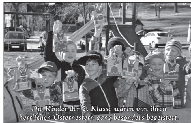
Die Kinder der 2. Klasse waren von ihren herrlichen Osternestern ganz besonders begeistert.