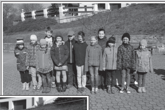
Alle Teilnehmer der 2. Stufe