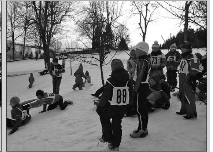
Auch gemeinsames Rodeln macht Spaß!