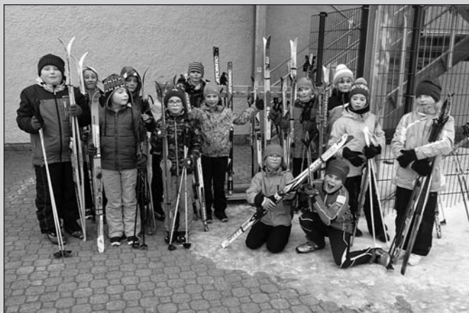
Hurra, wir haben einen Skiständer auf dem Schulhof! Endlich fallen unsere Skier bei Wind und Wetter nicht mehr um. Vielen Dank an die Tischlerei Ihle!