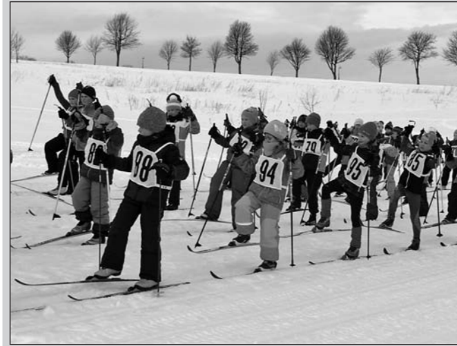
Gymnastik vor dem Wettkampf muss sein!