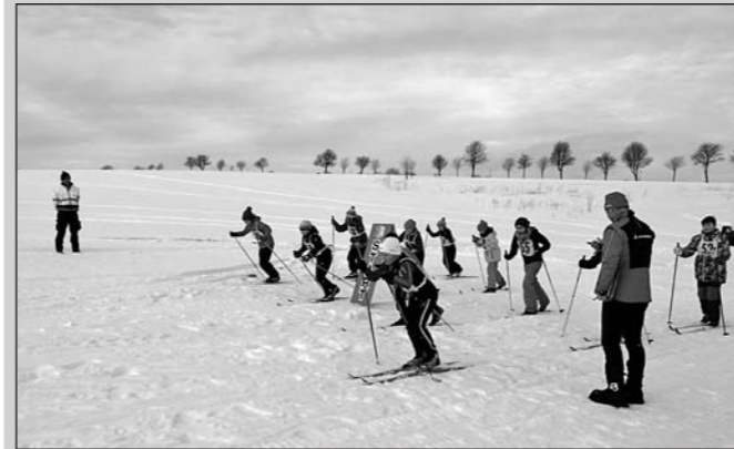
Klasse 4 am Start