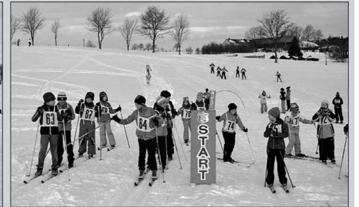
Klasse 3 am Start