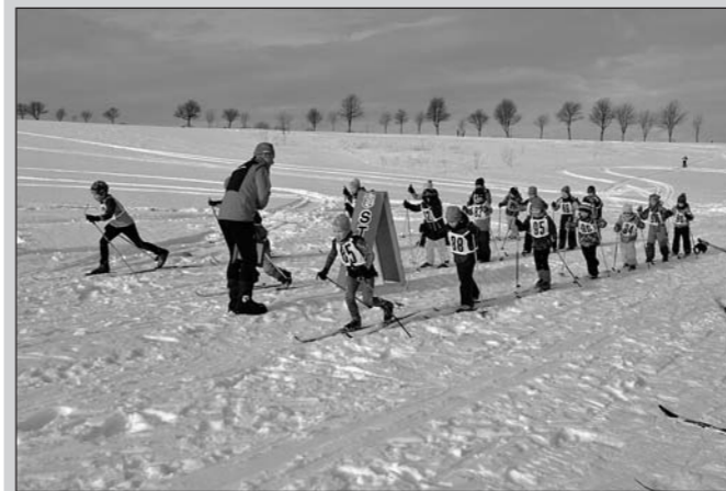
Klasse 1/2 am Start