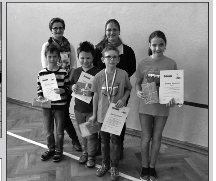
Zur Schülerversammlung am letzten Schultag durften sich diese Kinder über eine Belobigung des Fördervereins freuen. Damit erhielten sie eine schöne Anerkennung für ihre großen Bemühungen im Schulalltag.