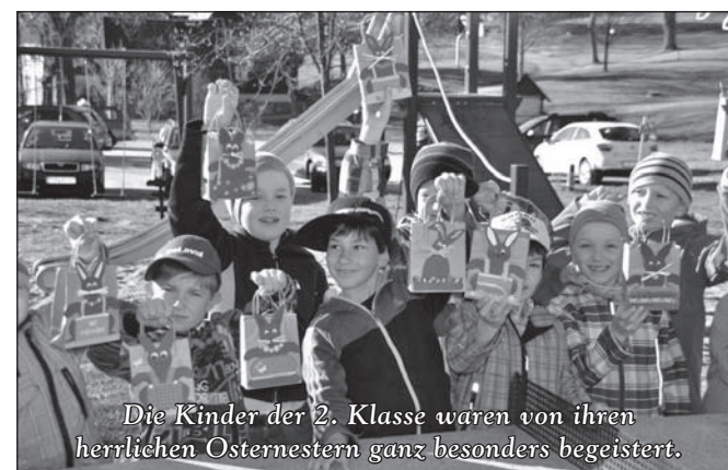
Die Kinder der 2. Klasse waren von ihren herrlichen Osternestern ganz besonders begeistert.