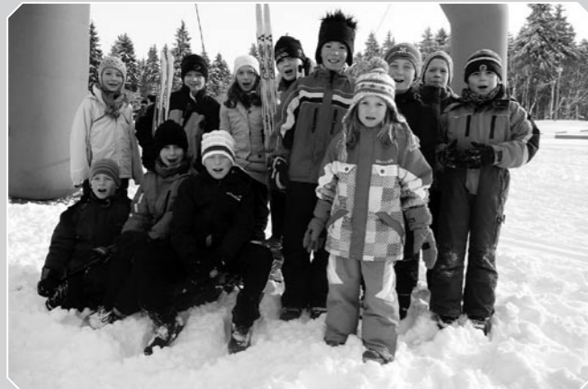
Alle erfolgreichen Teilnehmer am Schellerhauer Kammlauf am 29.1.