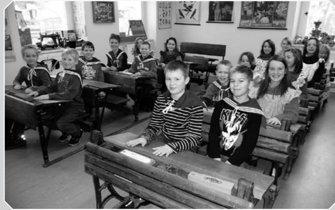
Schnuppertag in der Mittelschule Schmiedeberg